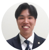
最優秀賞 【2年生の部】