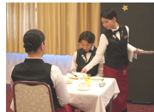
練習の成果を実感しました