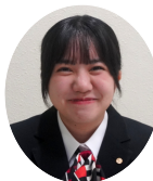
最優秀賞 【1年生の部】