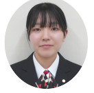
マナープロトコール検定3級

合格することができて嬉しく思います。正直とても不安でした。マナープロトコール検定三級は〇か×の二択択一で出題されるので、どのように勉強をすれば良いか迷いがありました。私はとにかく、問題集や過去問題を繰り返し解くこと、教科書の見直しや要点を抑えることを意識して勉強に励みました。この検定は、社会人に求められる幅広いマナーや国際儀礼の知識を得ることができ、冠