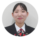
プライダールコーディネイト技能検定3級

入学前からプライダールプランナーの資格について耳にし、絶対取得すると決めていました。この試験は筆記と実技試験があり、筆記試験ではプライダールの授業や休み時間、訓練の休憩時間などにジェネレーターを使い何回も問題を解きました。実技では、映像を見て正しいか正しくないかを見極める問題で、何が問題とされるか分からなかったため、ドレスや引き出物の項目を中心に勉強し、試験本番では不安もありま