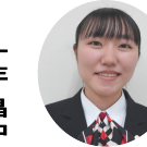
ホテルビジネス実務検定(1検)2級 全国1位

テルビジネス実務検定一級に向けて、勉強を頑張りたいと思います。効率的なノート作成と問題演習