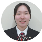
日本語ワープロ検定2級

定の勉強をして、自分の訓練先に繋げられることができた嬉しく感じました。次は二級以上の検定に向け引き続き勉強していきたいと思えます。